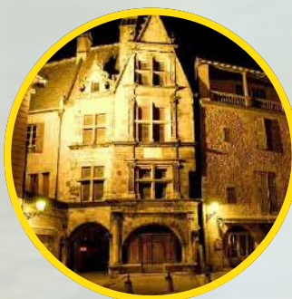
SARLAT Ville pittoresque