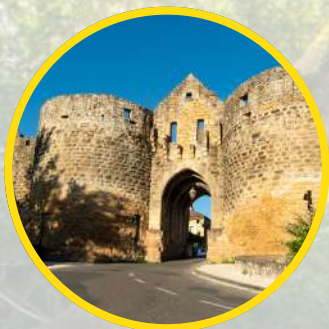
DOMME Cité médiévale