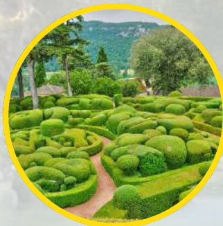
MARQUAYSSAC Jardins suspendus