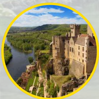
BEYNAC Chateau médiéval