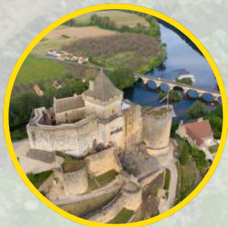
CASTELNAUD Chateau médiéval