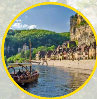
LA ROQUE GAGEAC Village pittoresque